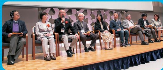
認知症関係当事者5団体の発表