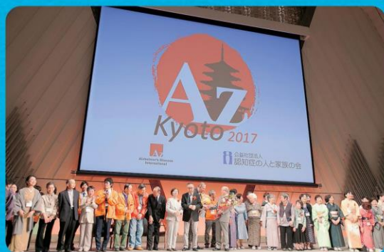
国際会議には国内外から4000人が参加

また、国際会議の準備から発表において、国内で初めて認知症関係当事者5団体(「家族の会」含む)が協働して取り組むなど、大きな成果がありました。一方で、認知症になっても安心して暮らせる社会になるには、下記のような課題も残っています。