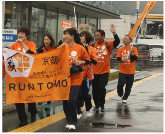
園部病院・希繫チーム