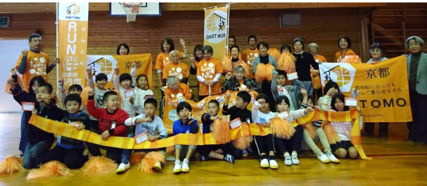
スタートイベント(美山小学校)