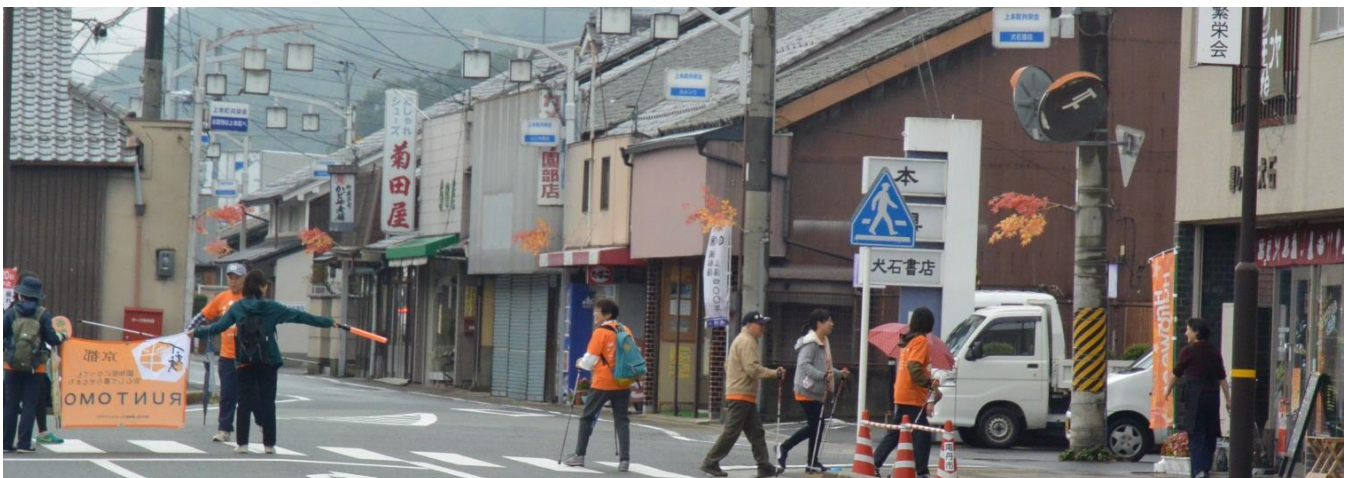
園部町本町商店街