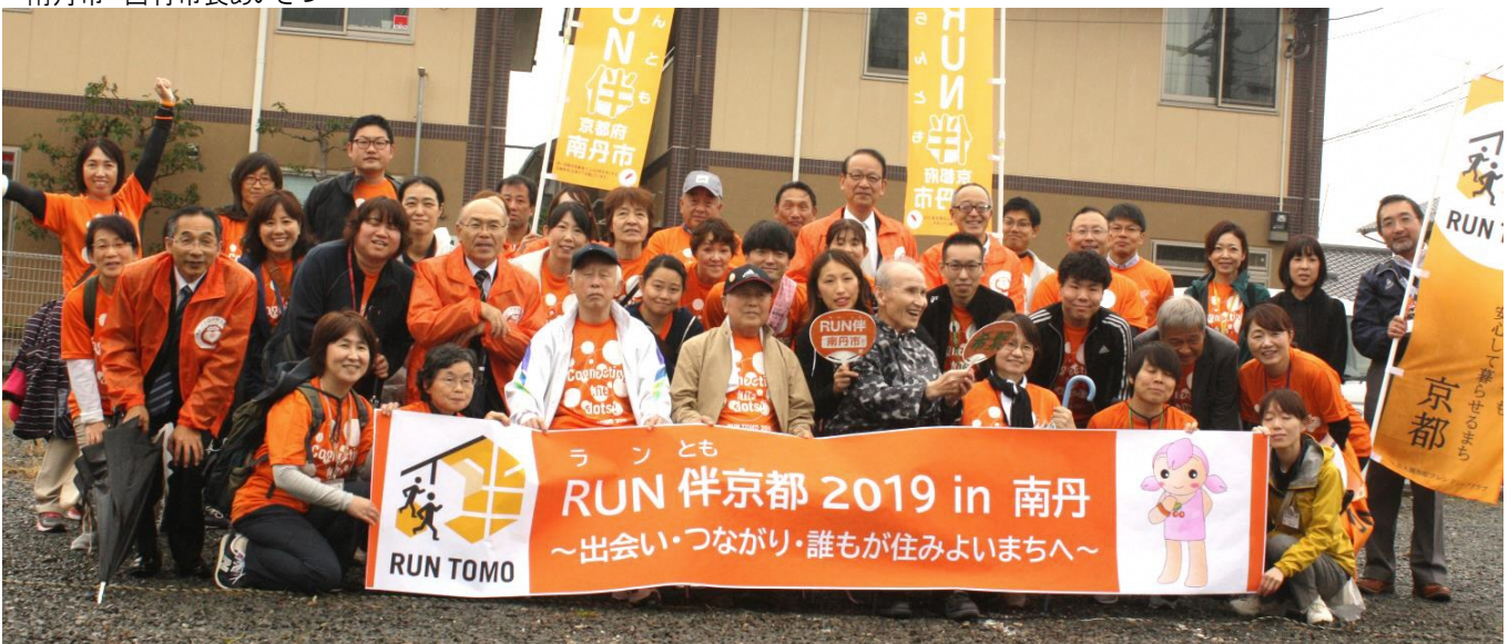
スタートイベント(園部)