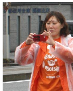
実行委員・運営スタッフ