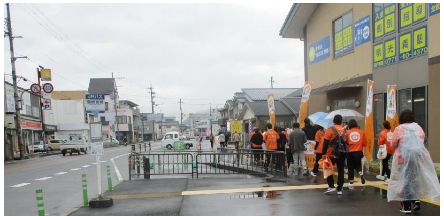
歩き・ポールウォーキングチーム