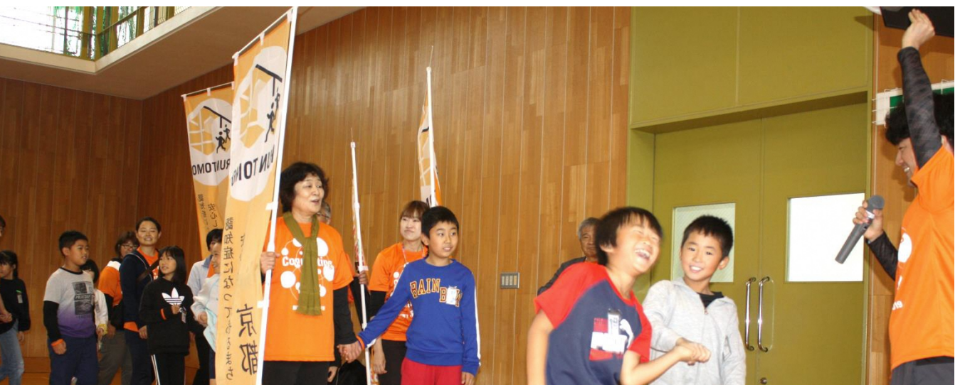
ゴールイベント(園部第二小学校)